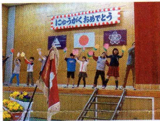
今年も頑張るぞ!!「岡元小」

本校は、小規模校の特色を生かし児童一人一人を大切にした「分かる授業・楽しい授業」を実践していきます。