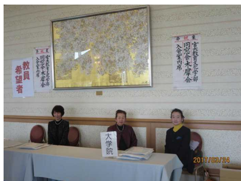
【 卒業生への資料 】