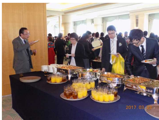
【 祝 宴 ② 】