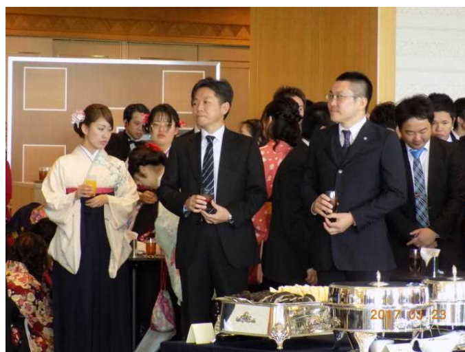
【 祝 宴 ① 】