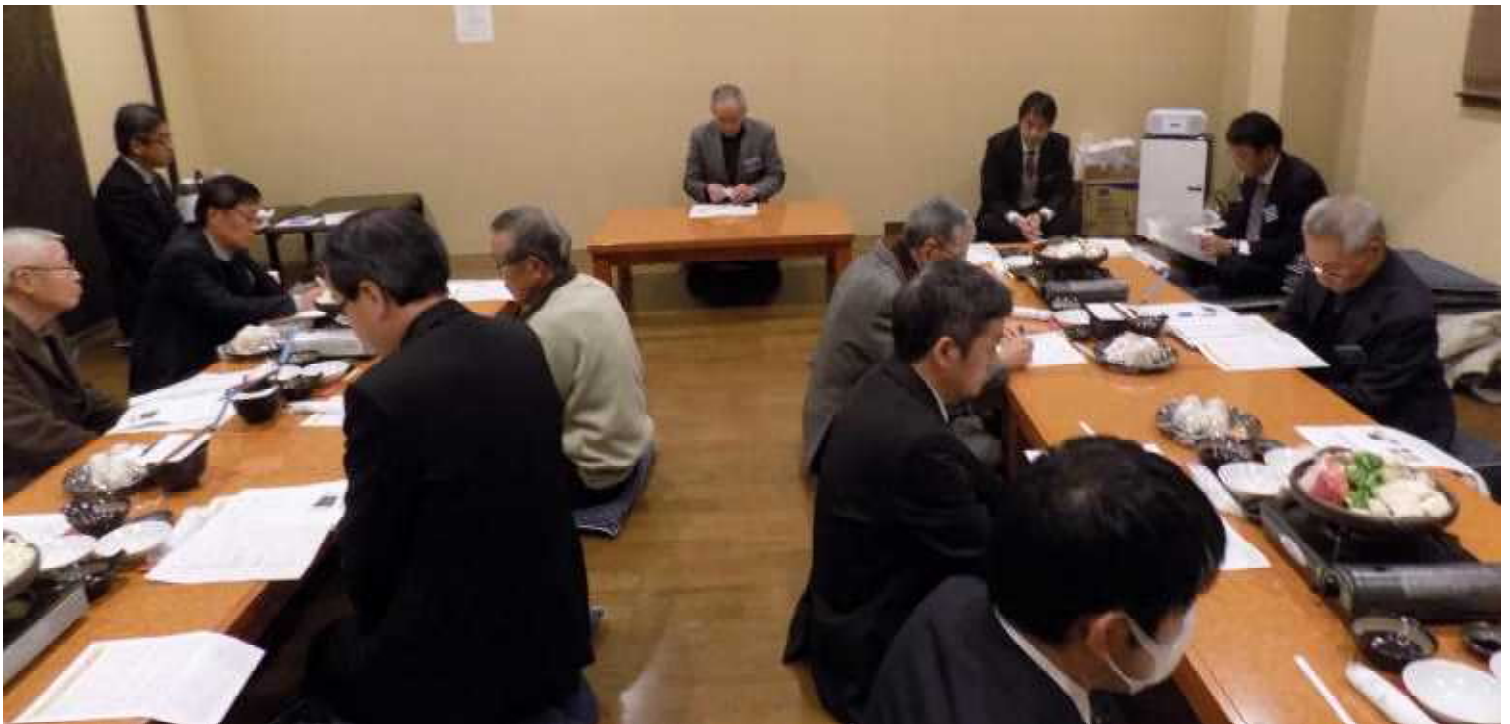
【 協議の様子 】

協議では、「西諸地区木犀会内規」の改正案が提案され、大変すっきりとまとめられた内規となっていました。西諸支部では、事務局が現職運営委員の学校に置かれ、現職会員からも会費が年間100円徴収されて運営されているようです。